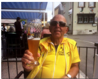
Gruss aus Appenzell

Die Redaktion wartet auf den Bericht von einem der beiden Teilnehmer!!!